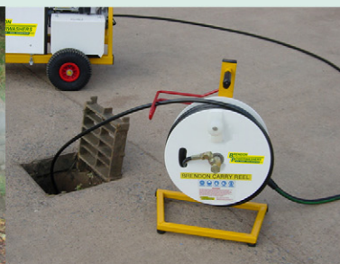
Hochdruckstrahler für Kanalisation