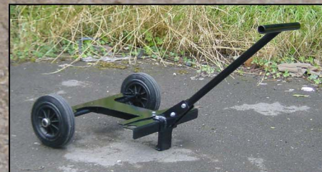
Kit chariot en option