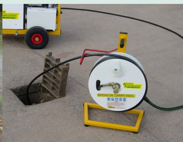
Kit de débouchage